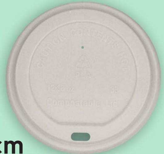
9cm Tapa Pla