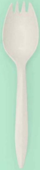
Cuchara pastelera 5.5" Fécula de maíz