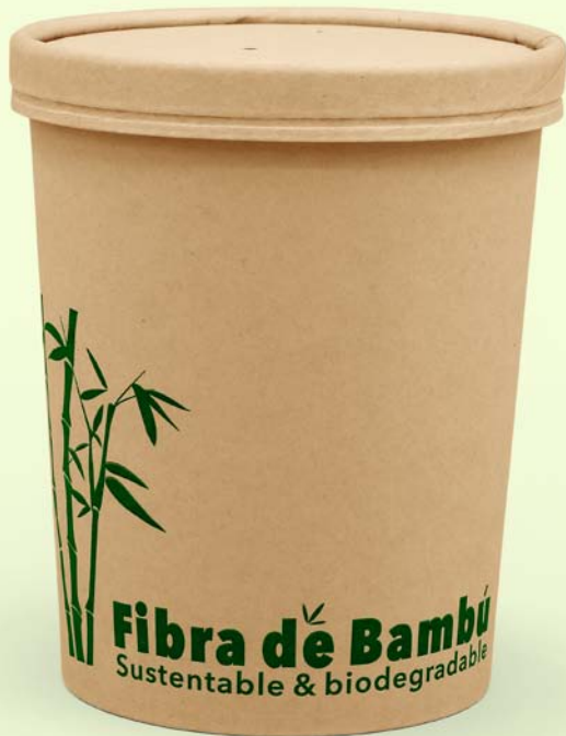
32 oz Fibra de bambú