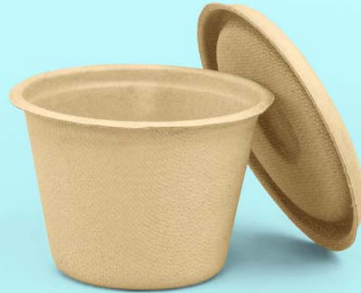
Caña de azúcar