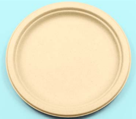
Caña de azúcar