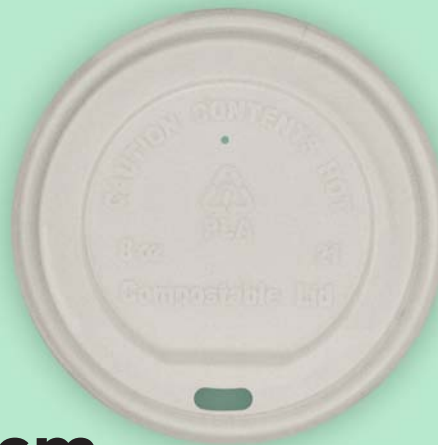
8cm Tapa Pla