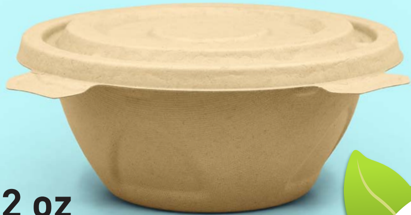
32 oz Contenedor sopa Caña de azúcar