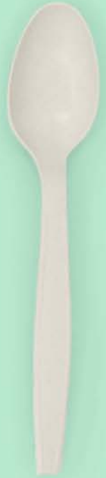
Cuchara 7" Fécula de maíz