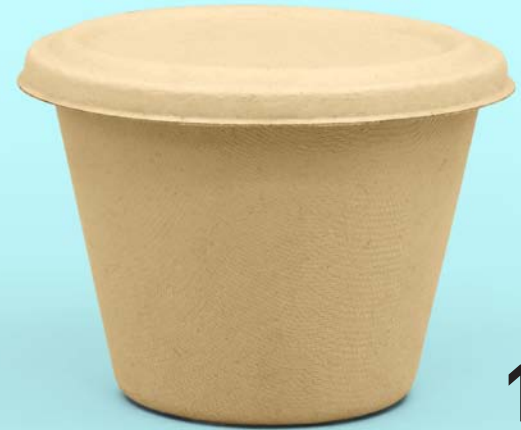
16 oz Contenedor sopa Caña de azúcar