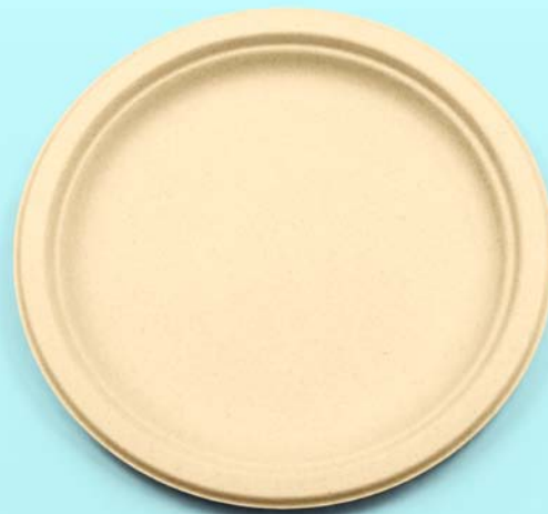
Caña de azúcar