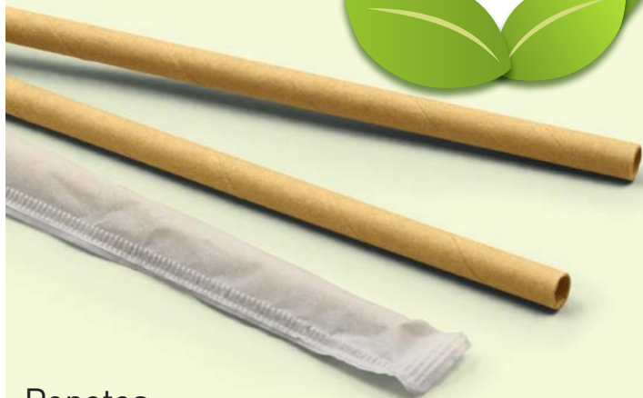
Popotes Fibra de bambú