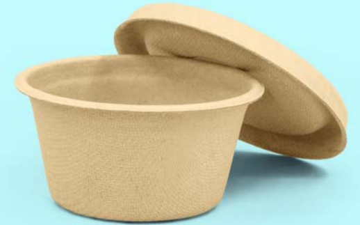
Caña de azúcar