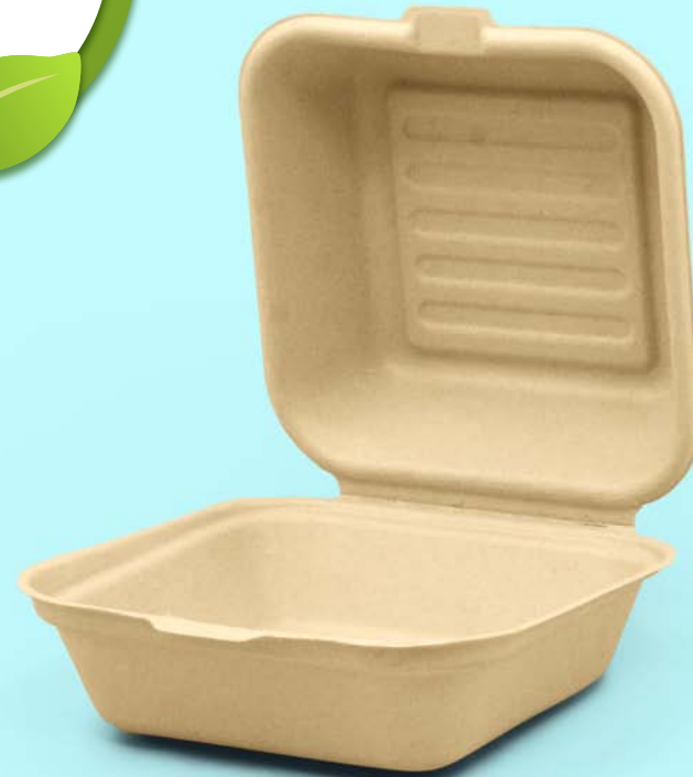
6" x 6" Caña de azúcar